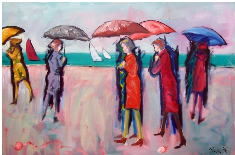
Zlatko Prica, iz ciklusa „Opatijski kišobrani“, ulje na platnu, 1996.