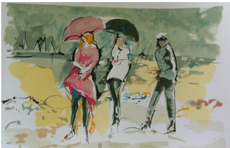
Zlatko Prica, iz ciklusa „Opatijski kišobrani“, grafika, 1996.