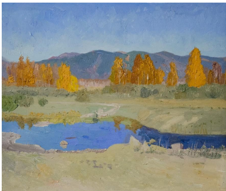
Victoria Rabzhaeva, „Rječica Haljuta“, ulje na platnu, 2013.