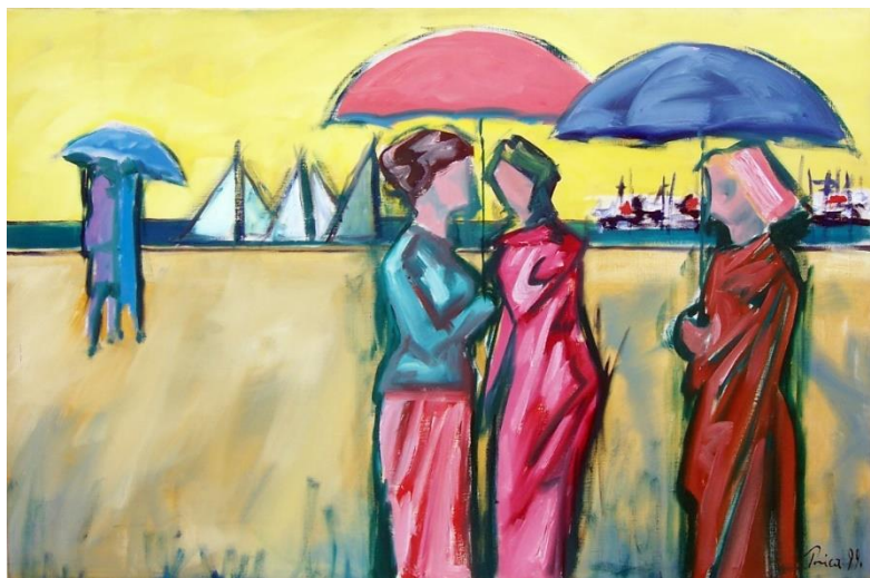
Zlatko Prica, iz ciklusa „Opatijski kišobrani“, ulje na platnu, 1999.