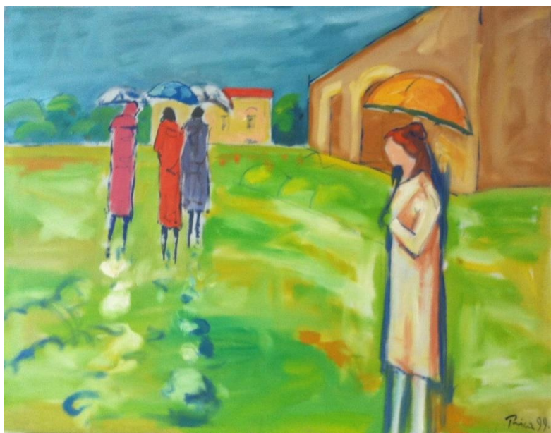
Zlatko Prica, iz ciklusa „Opatijski kišobrani“, ulje na platnu, 1999.