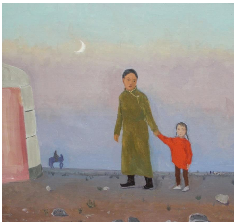
Victoria Rabzhaeva, „Mladi mjesec“, ulje na platnu, 2014.